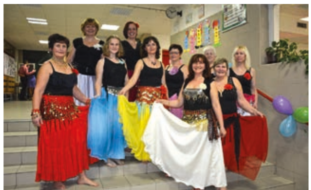
Školní ples s vystoupením břišních tanečnic