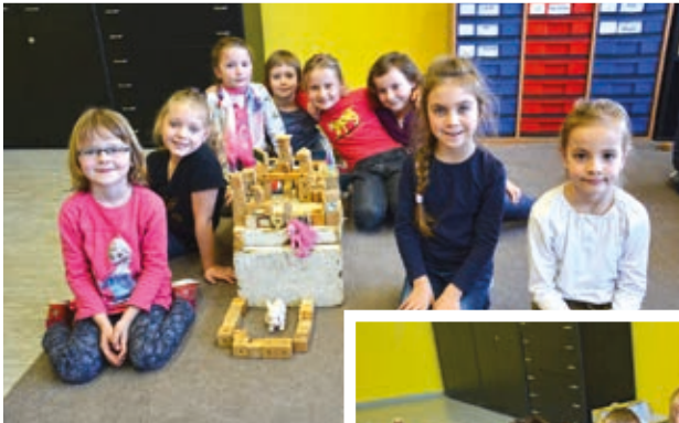
Naši prvňáci - děvčata