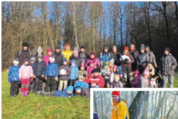
Novoroční pochod Rezon a hasiči