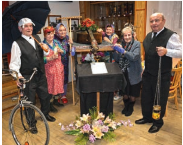
Aktéři pochování basy