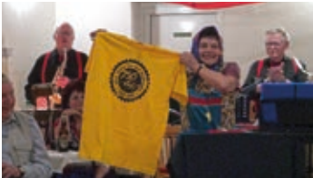
Předsedkyně KD s tričkem 750 let Staré Vsi