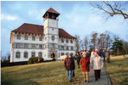
Průběh ceremoniálu, přesun k pomníku T.G.M.