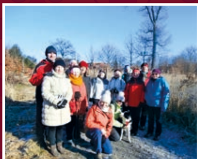
Účastníci novoročního pochodu