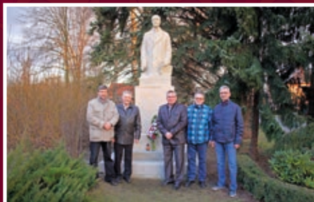
Závěr ceremoniálu s představiteli obce