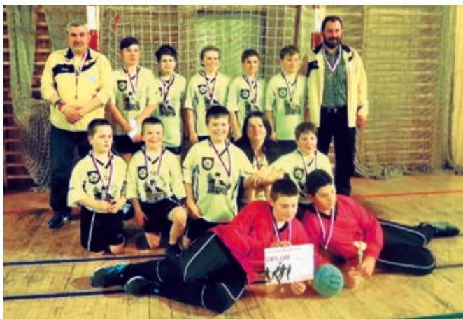
Bronzoví mladší žáci - finále ZHP ve Staré Vsi

Mladší žáci skončili v ZHP celkově na 4. místě. Náš oddíl však byl pověřen pořádáním zimního halového mistrovství, a tak se naši hoši turnaje zúčastnili jako domácí družstvo. Při vynikající atmosféře turnaje, kdy povzbuzovaly fancluby všech týmů a hala doslova vřela, podali naši chlapi pěkný kolektivní výkon a obsadili výborné 3. místo. Kladně byla hodnocena i organizace turnaje, včetně zajištění jídla, občerstvení a noclehu.