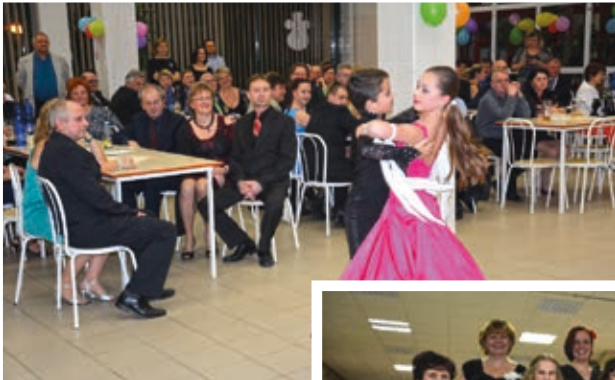
Školní ples s vystoupením moderních tanců