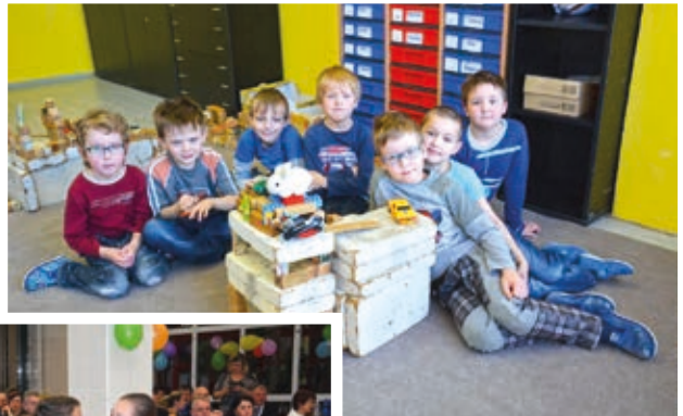
Naši prvňáci - kluci