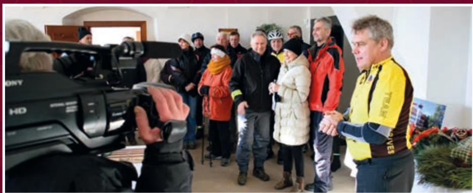
Vernisáž výstavy k novoročním jízdám a pochodům