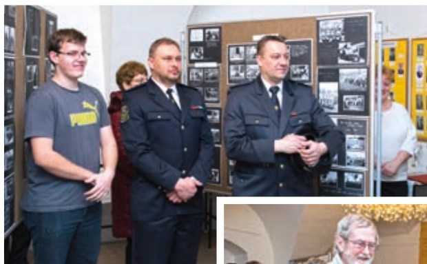
Staroveští hasiči před svou částí výstavy