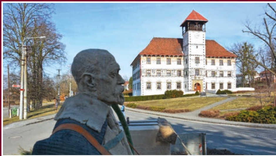
Přivezi opraveného Masaryka