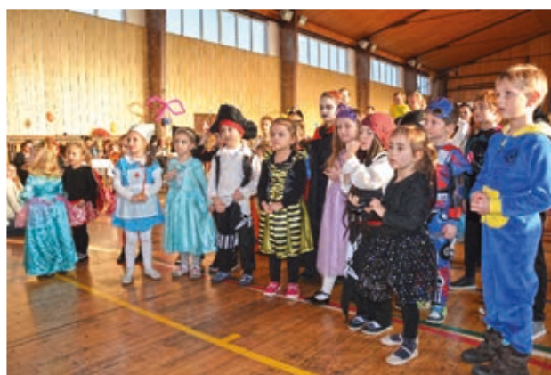
Pestré kostýmy dětských účastníků