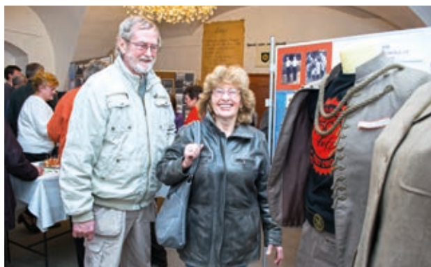
Sokolská část výstavy