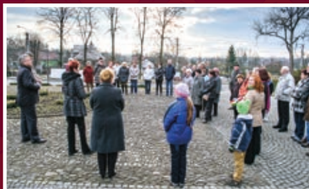
Setkání u příležitosti odhalení restaurované sochy T. G. Masaryka