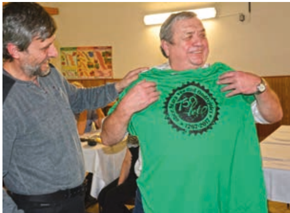
Při příležitosti Staroveského koštu