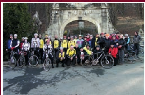
Po přjezdu na Hukvaldy