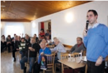
Beseda nad staroveským kalendářem