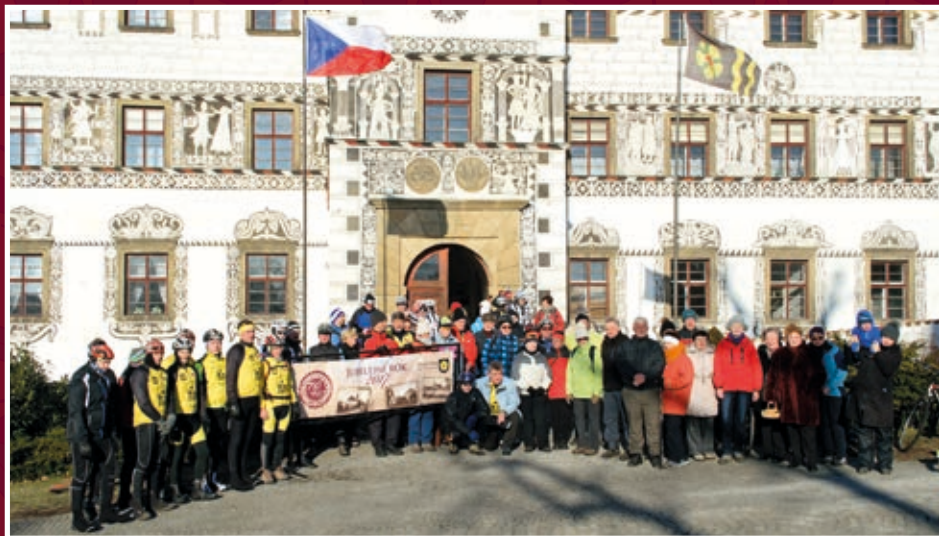
Nový rok před zámekm