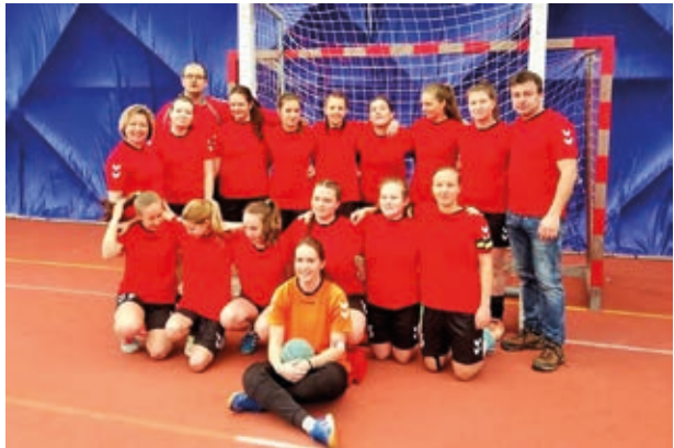
Bronzové dorostenky na ZLM

Ve finále naše děvčata nestačila pouze na západočeský Tymákov a Plzeň-Újezd. Třetí místo je pěkný úspěch.