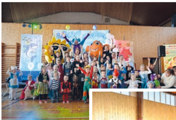
Dětský maškarní s Hopsalínem